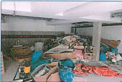
Dann ran an den Dreck!