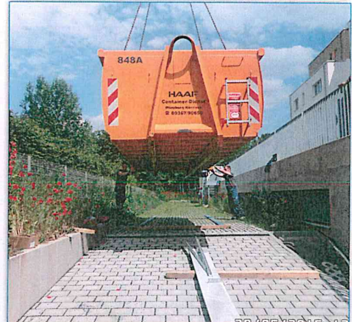
Hölzer etc. ausgelegt, damit die neuerlegten Pflastersteine nicht beschädigt werden.