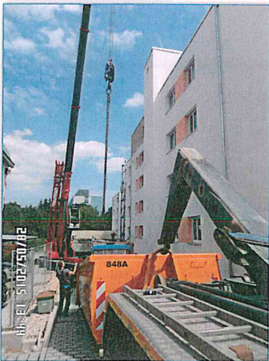
Container wird angeliefert