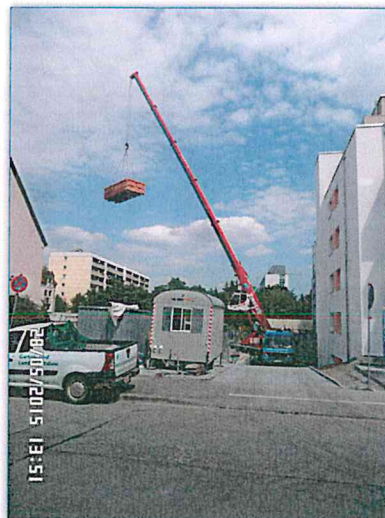
Per Kran an die richtige Stelle gehoben