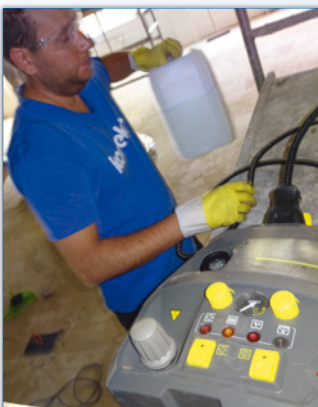
Auf neuen Wegen und mit speziellen Reinigungsgeräten wie diesem Kärcher-Dampfreiniger kommen wir jedem Schmutz bei.