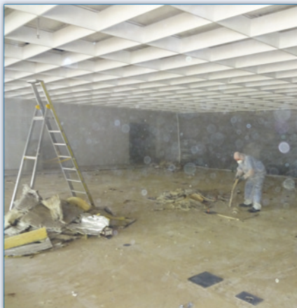
Anschließend Grobreinigung des Bodens