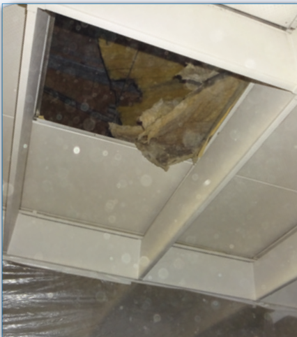
Durch die Einstiegsöffnung wurden die Vliese entsorgt.