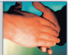
Zum Schluss Einlegen der neuen Vliese: Teamwork, Hand-in-Hand

Die wahre Kunst der Zusammenarbeit liegt darin dem Andern die Hand zu reichen!