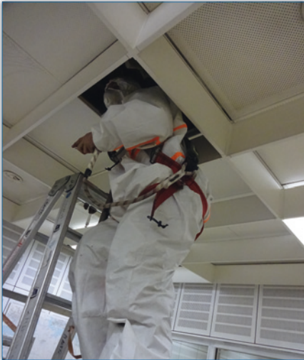
Einstieg in die Decke! Mit Vollschutzanzug, Mundschutz, Sicherheitsgurt