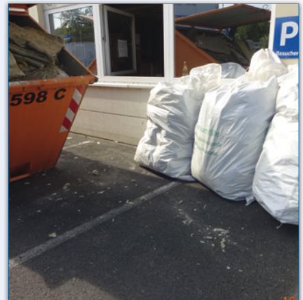
Alte Vliese ordnungsgemäß im Container entsorgen, ca. 15 Tonnen Abfall!